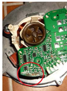
Ventilateur endommagé et apparition du défaut E08.