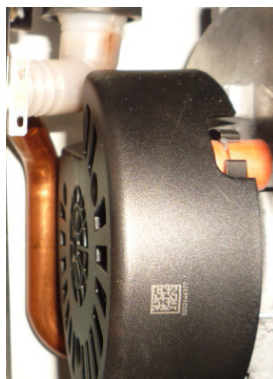
Ecoulement de condensats sur le ventilateur.