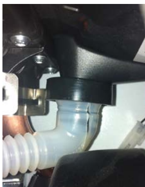
Tube de raccordement siphon défectueux.

La fuite de condensats au niveau du raccord peut détériorer le ventilateur.